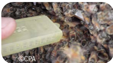
Ne pas oublier de relâcher la reine !

Pour plus de renseignements, vous pouvez prendre contact avec le CPA Tél : 44.15.79 ou consulter notre site internet : www.technopole.nc