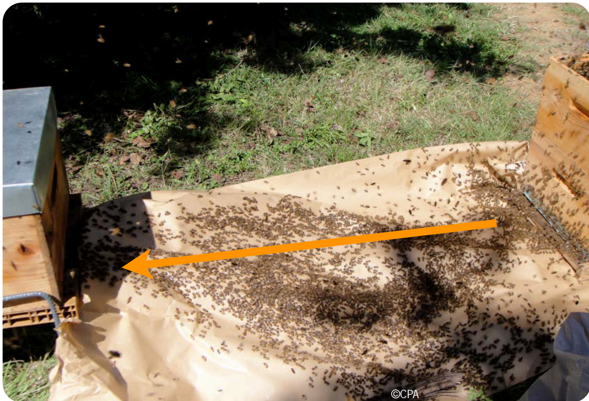
Migration des abeilles vers leur nouvelle «maison»