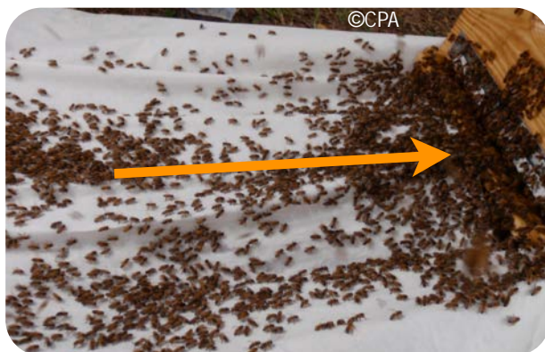
Autre illustration de la migration des abeilles vers leur ancien emplacement