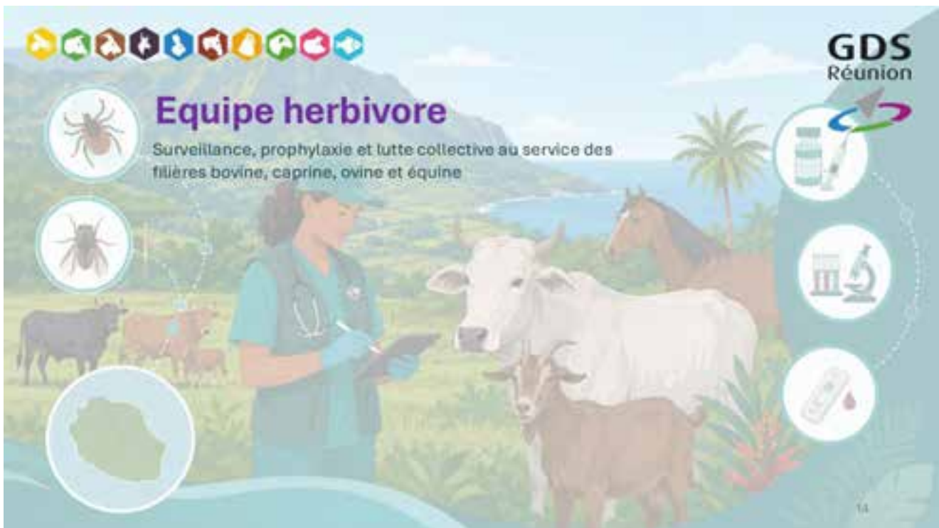
Surveillance, prophylaxie et lutte collective — filières bovine, caprine, ovine, équine