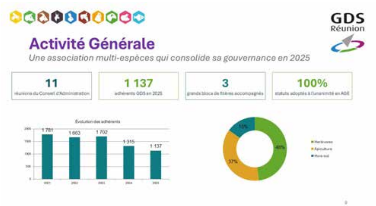
Activité générale et évolution des adhérents