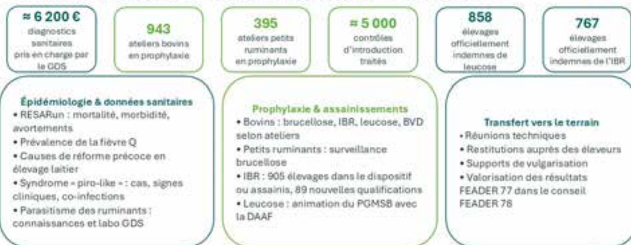
Chiffres clés épidémiologie, prophylaxie et assainissement herbivores

Mieux connaître les risques, organiser les campagnes et suivre les assainissements