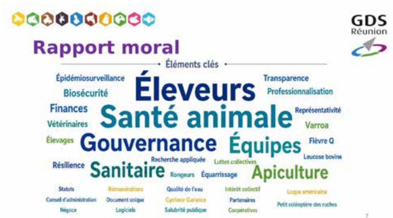
Nuage de mots-clés du rapport moral — éléments saillants de l'année 2025