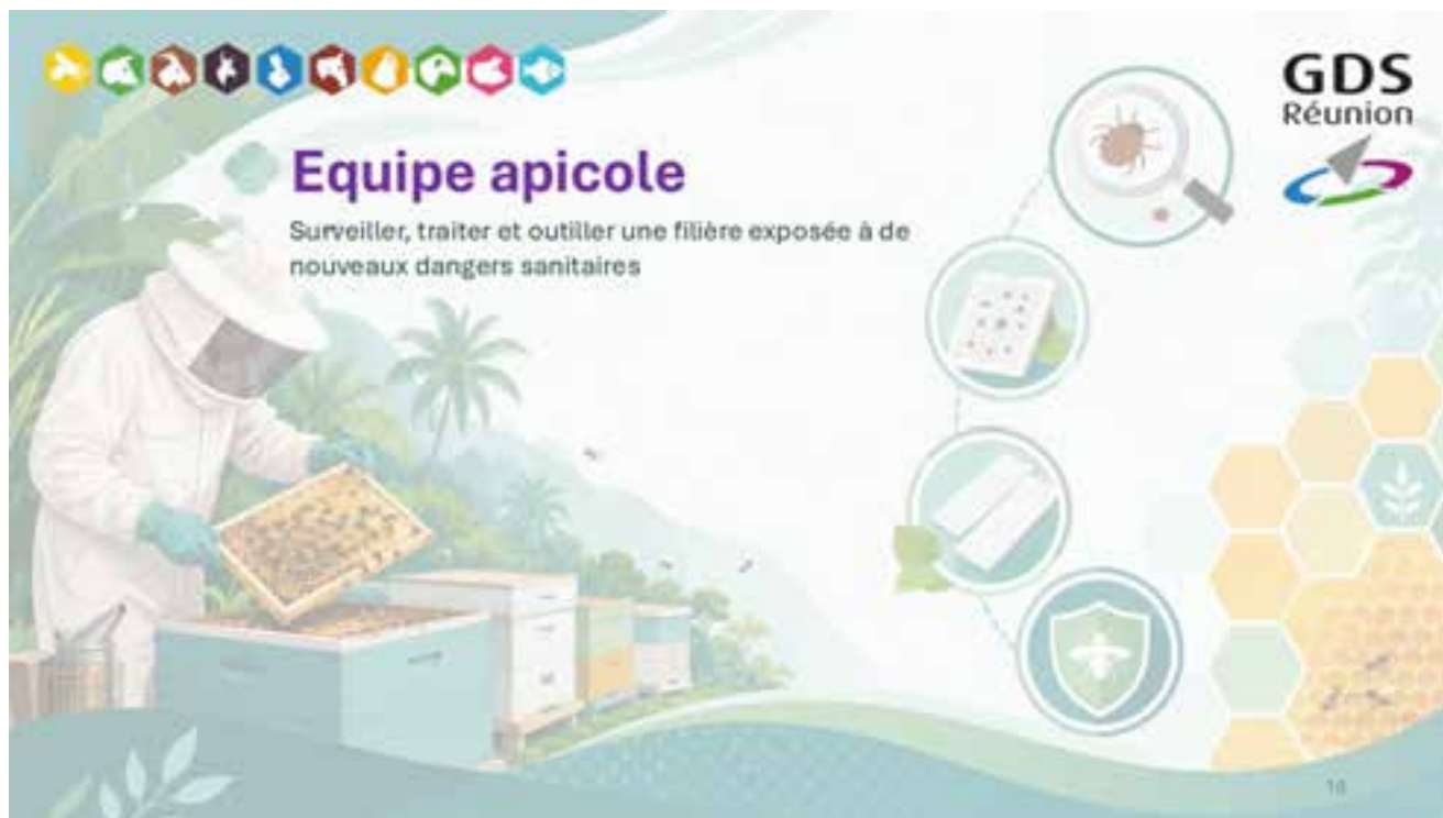
Surveiller, traiter et outiller une filière exposée à de nouveaux dangers sanitaires