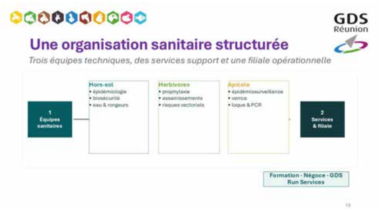
Organisation sanitaire structurée : 3 équipes techniques + 2 services & filiale